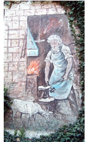
Wandbild "Wilder Schmied"

Wir beginnen am Wanderparkplatz Hotel „Kaiserhof“ in PW-Barkhausen und gehen ca. 200m in nördliche Richtung bis zum Aufgang „Goethe Freilichtbühne“. Wir folgen der Straße „Unter den Tannen“ 500m und biegen nach links auf die Kaiserstraße. Nach ca. 200m biegen wir nach rechts auf den Philosophenweg und gehen weiter in westl. Richtung 1900m bis zum Rastplatz „Lebensborn“. Weiter geht es dann 400m zum „Fuchstanzplatz“ und 900m bis zum Naturfreundehaus Mi-Häverstädt. Wir biegen nach links 200m bergauf, dann wieder 1300m westwärts bis zum Gasthaus „Wilder Schmied“. Von hier gehen wir 450m bergab in südliche Richtung und weiter ca 650m in südöstliche Richtung. Wir biegen nach links und erreichen nach 500m die alte Wallanlage „Dehmer Burg“. Von hier geht es 2200m bis zu Erbbegräbnis „Gut Wedigenstein“ und weiter 800m bis zur Wegegabelung A1/A2 . Wir folgen dem Weg A1 800m bis zum Wanderparkplatz zurück.