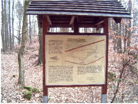
Alte Wallanlage „Dehmer Burg“

Wanderung am Nord- und Südhang des ostwärtigen Wiehengebirges mit Ausblick auf die Norddeutsche Tiefebene (Minden) und das Minden- Ravensberger Hügelland.