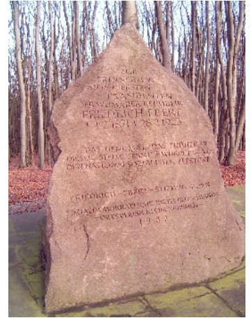
Friedrich-Ebert-Denkmal auf dem Papenbrink