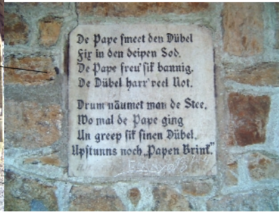
Inschrift an der Königshütte