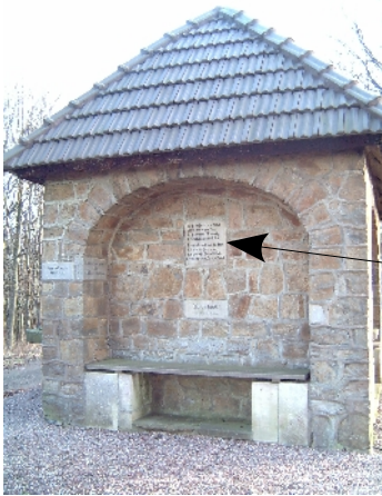
Königshütte auf dem Papenbrink Höhe [m]

Höchste Erhebung der Stadt Porta Westfalica.