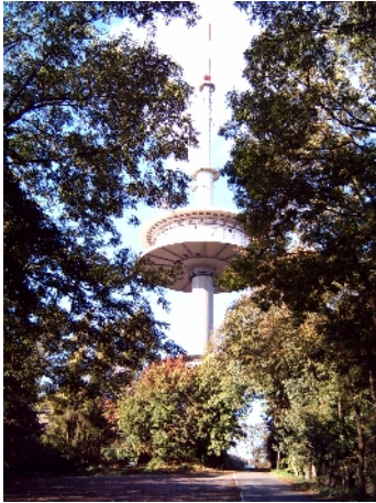
Fernmeldeturm auf dem Jakobsberg / Wesergebirge