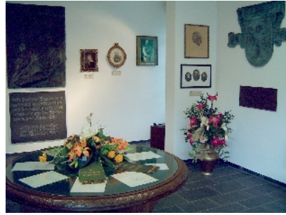
Bismarckgedenckzimmer am Fernmeldeturm

Rundumfersicht über die Norddeutsche Tiefebene und das Ravensberger Hügelland vom Fernmeldeturm