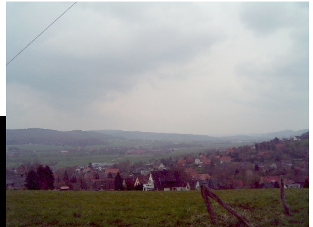
Blick Richtung Osten