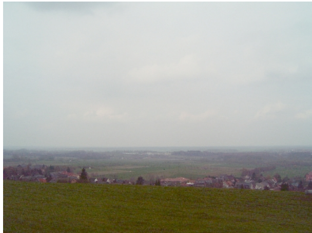
Blick Richtung Norden