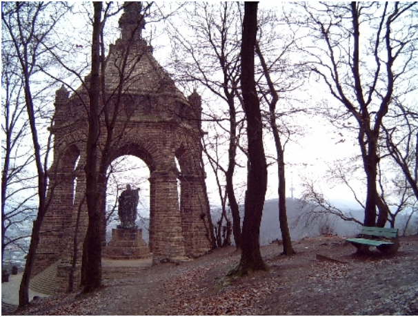
Kaiser-Wilhelm-Denkmal mit Blick auf den Fernmeldeturm / Wesergebirge