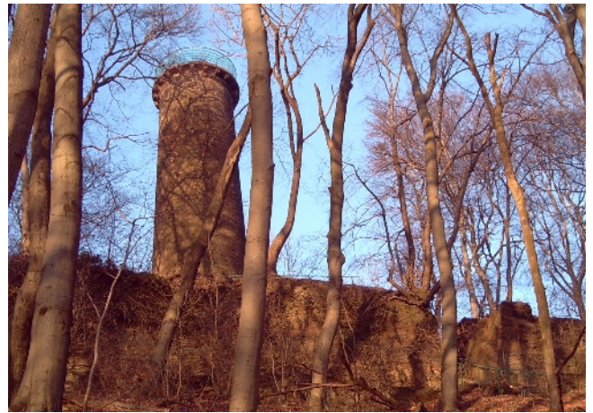
Moltketurn / Wiehengebirge