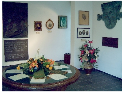
Bismarckgedenckzimmer am Fernmeldeturm