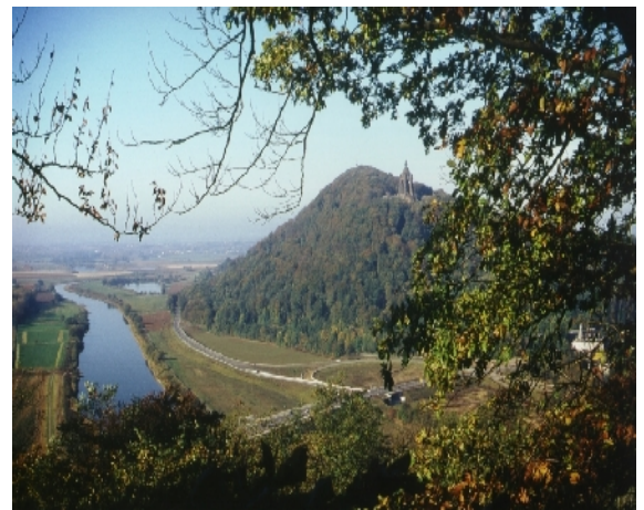
Blick von der Porta-Kanzel zum Kaiser-Wilhelm-Denkmal / Wiehengebirge