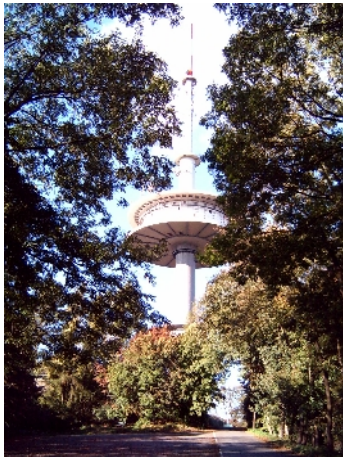
Fernmeldeturm auf dem Jakobsgberg / Wesergebirge