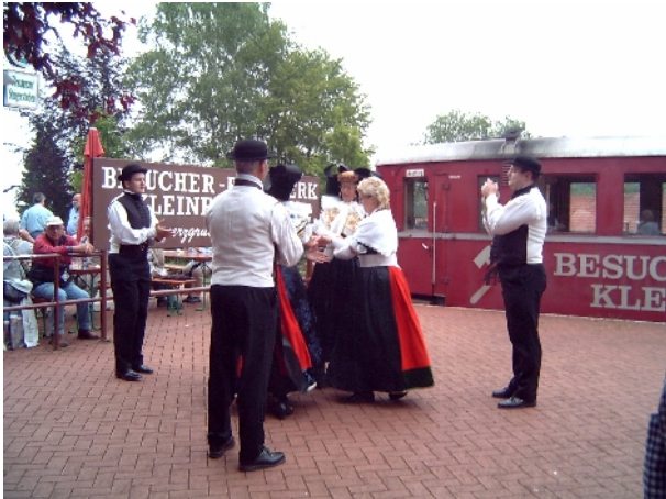
Trachtengruppe Kleinenbremen am Besucherbergwerk