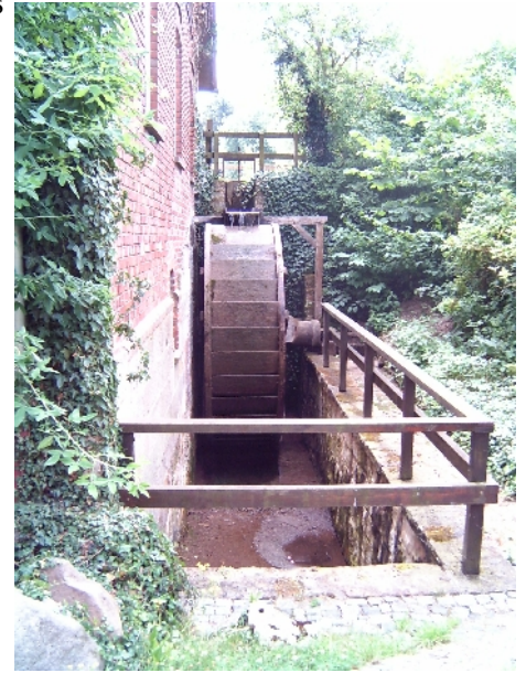
Wassermühle in Kleinenbremen