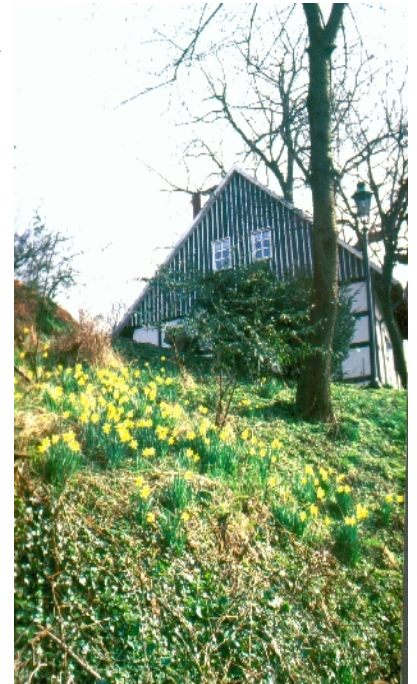
Wilde Narzissen im Landschaftspark "Hohler Weg"