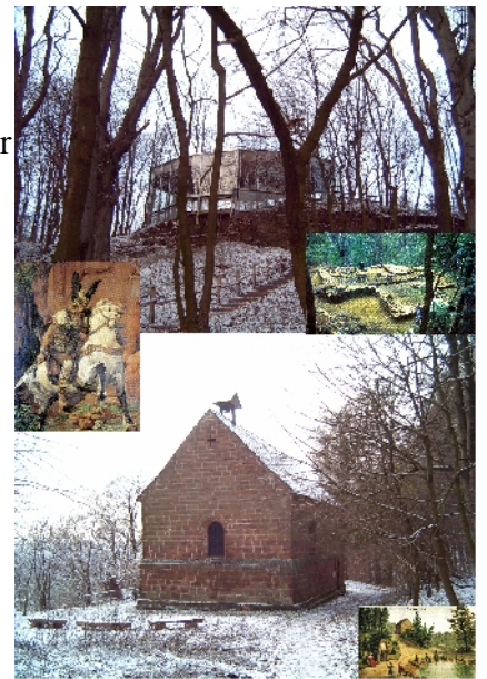
Areal Wittekindsburg mit Grundmauern der Kreuzkirche und Margarethenklus