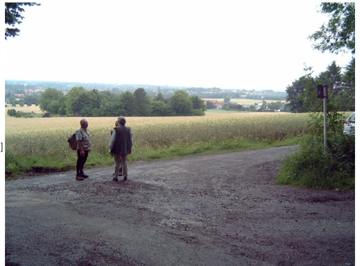
Fernsicht vom Wanderparkplatz "Unterm Berge"