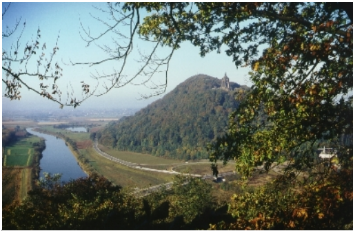
Blick von der Porta-Kanzel zum Kaiser-Wilhelm-Denkmal / Wiehengebirge