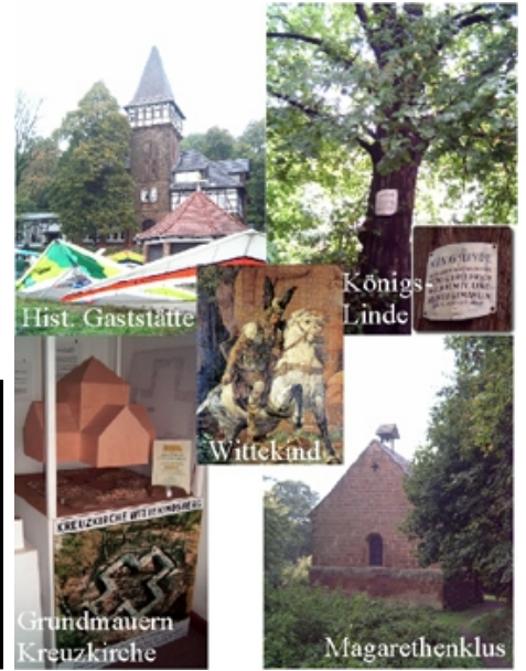
Areal Wittekindsburg / Wiehengebirge

Wir beginnen am Wanderparkplatz „Kaiserhof“ und gehen in südliche Richtung auf dem A1/A2 ca. 800m bis zur Wegegabelung. Hier halten wir uns auf dem A1 und wandern 3000m westlich am Gut Wedigenstein und dem Erbbebränis vorbei bis zur alten Wallanlage „Dehmer Burg“ . Ab hier geht es 1100m in nördlicher Richtung bergauf zur Gaststätte „ Wilder Schmied “ und weiter in ostwärtige Richtung auf dem Wittekindsweg 2200m zur Wittekindsburg . Nach weiteren 700m erreichen wir den Moltketurm und nach weiteren 800m das Kaiser-Wilhelm-Denkmal . Von hieraus geht es auf dem in östliche Richtung 1200m bergab an der Goethe-Freilichtbühne vorbei und wir erreichen nach ca. 400m den Ausgangspunkt.