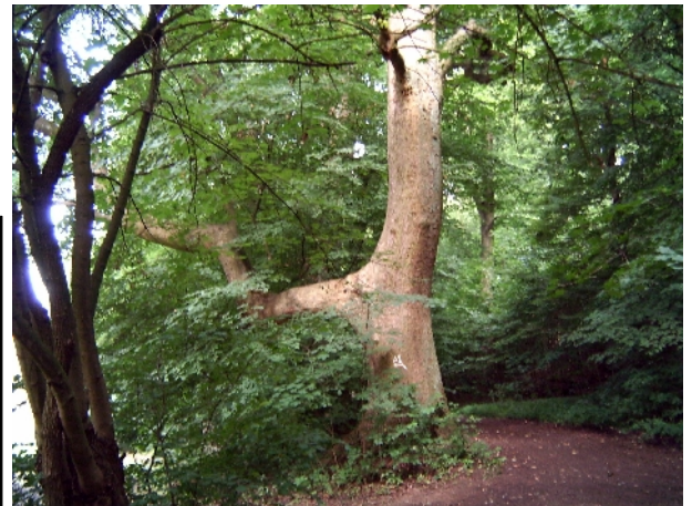
"Musikantenbaum" Areal Wittekindsburg / Wiehengebirge