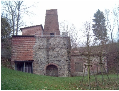
Alter Kalkofen in P-W Nammen