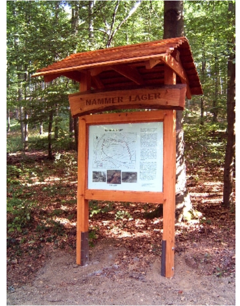
Geschichtstafel am Nammer Lager