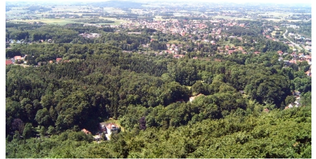
Blick vom Fernmeldeturm auf das Wandergebiet Hausberge / Holzhausen

Zeichnung: A1 / B / A5 Rundweg: 12 km = 4 Std.