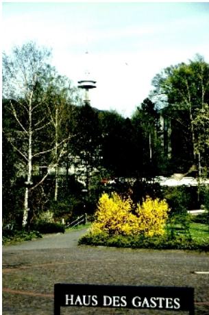
Blick vom Kurpark zum Fernmeldeturm