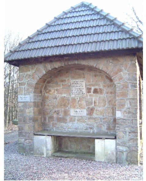
Königshütte auf dem Papenbrink