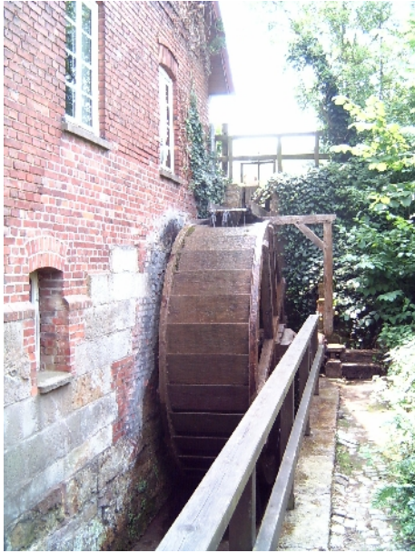
Wassermühle in P-W Kleinenbremen