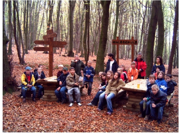
Waldschule am hist. Kreuzplatz / Wesergebirge