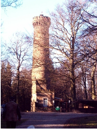
Idatumm Harri / Bückeberg

Wanderung im „Alten Dreiländereck“ (Fürstentum Minden – Fürstentum Schaumburg-Lippe und Grafschaft Schaumburg)